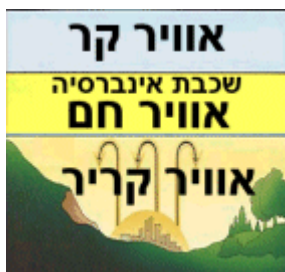
איור 1. מצב אינברסיה

קרה קרינתית - הקרה השכיחה והממושכת ביותר, האופיינית לאזורים מישוריים וקעורים. מתרחשת בלילות קרים, יבשים, שקטים (כמעט ללא רוח) ובהירים (ללא עננות). כתוצאה מאיבוד חום לאטמוספירה בקרינה ארוכת גל, הקרקע והשכבות שמעליה מתקררות. האוויר קר וכבד, ובדומה לנוזל צמיג הוא זורם בשטחים מדרוניים אל המקומות הנמוכים ומתנקז בהם בשכבות, כששכבת האוויר הקרה ביותר נמצאת קרוב לפני השטח, מעליה שכבה חמה מעט יותר וכך הלאה. כך נוצר מצב שבו ערכי הטמפרטורה עולים עם הגובה (אינברסיה של טמפרטורה - איור 1).